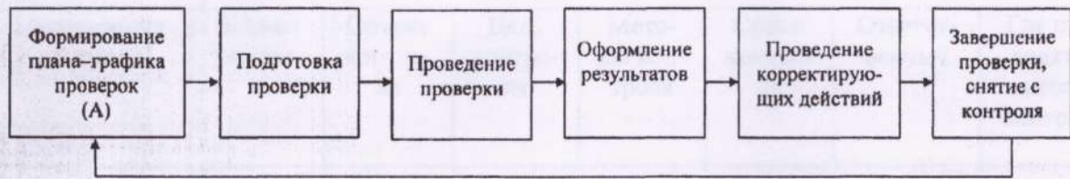
Формирование плана-графика внутриучрежденческого контроля (А)